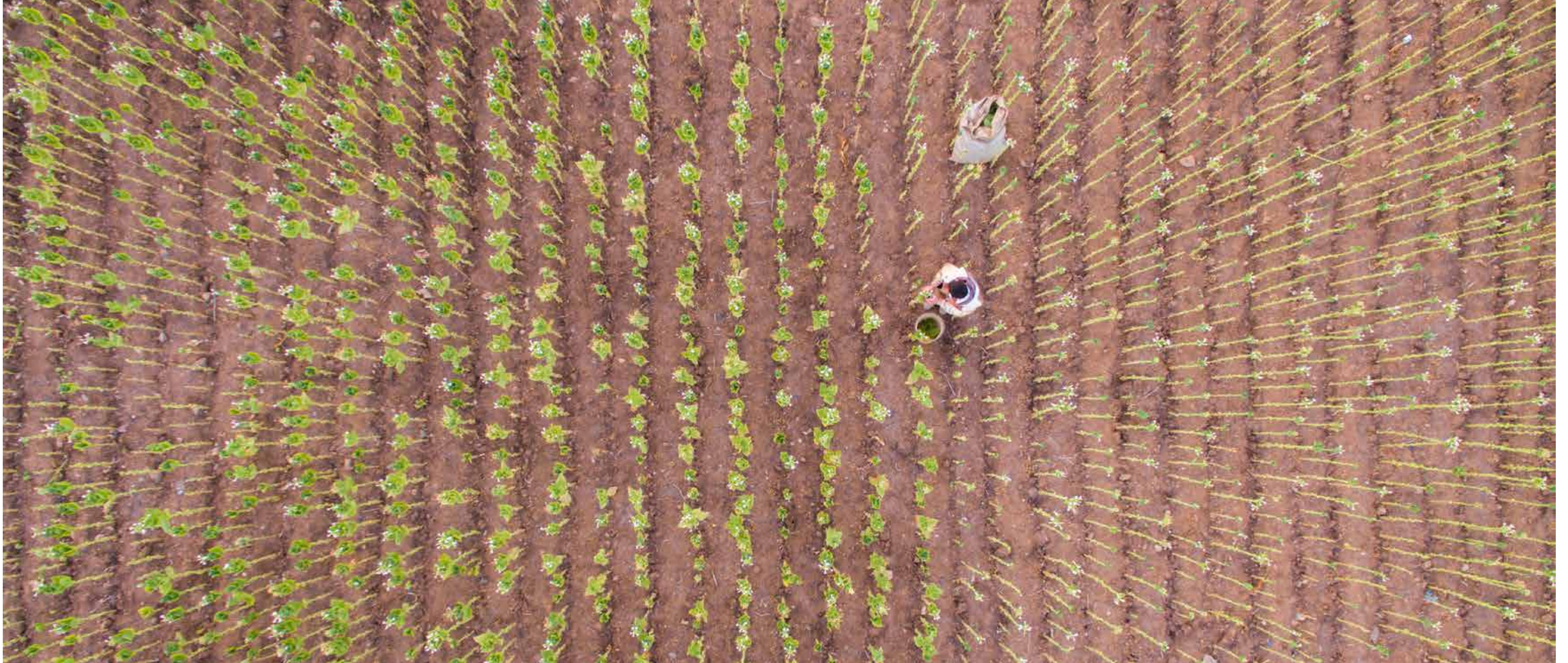
«من الأرضِ للسّماءِ.»