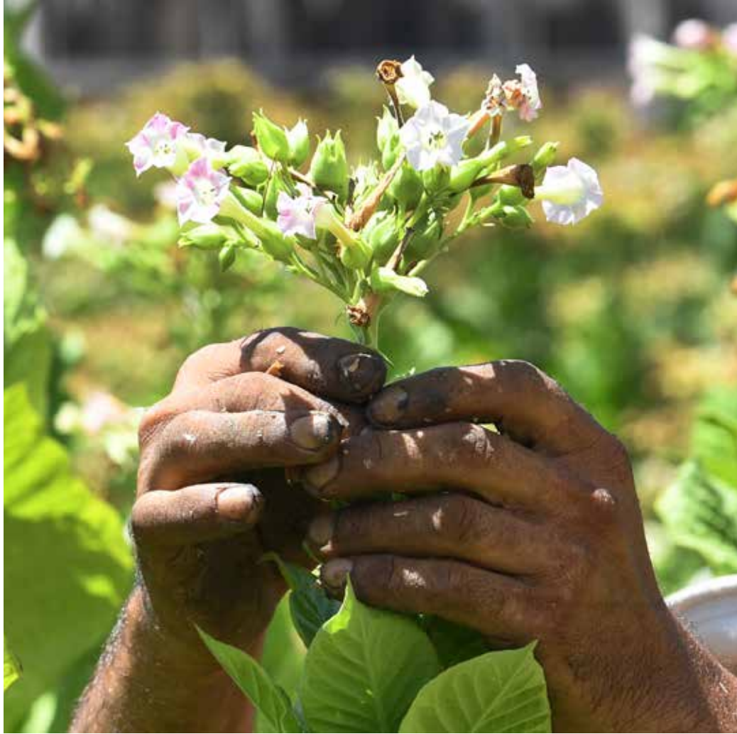
تتفتّحُ على الصَّوءِ بين يديه، كأنَّ أصابعَهُ لِيالٍ عَشْرَ.

لا يزالُ على براءتِهِ، يَجْتَنِهُ الضَّحِكُ.