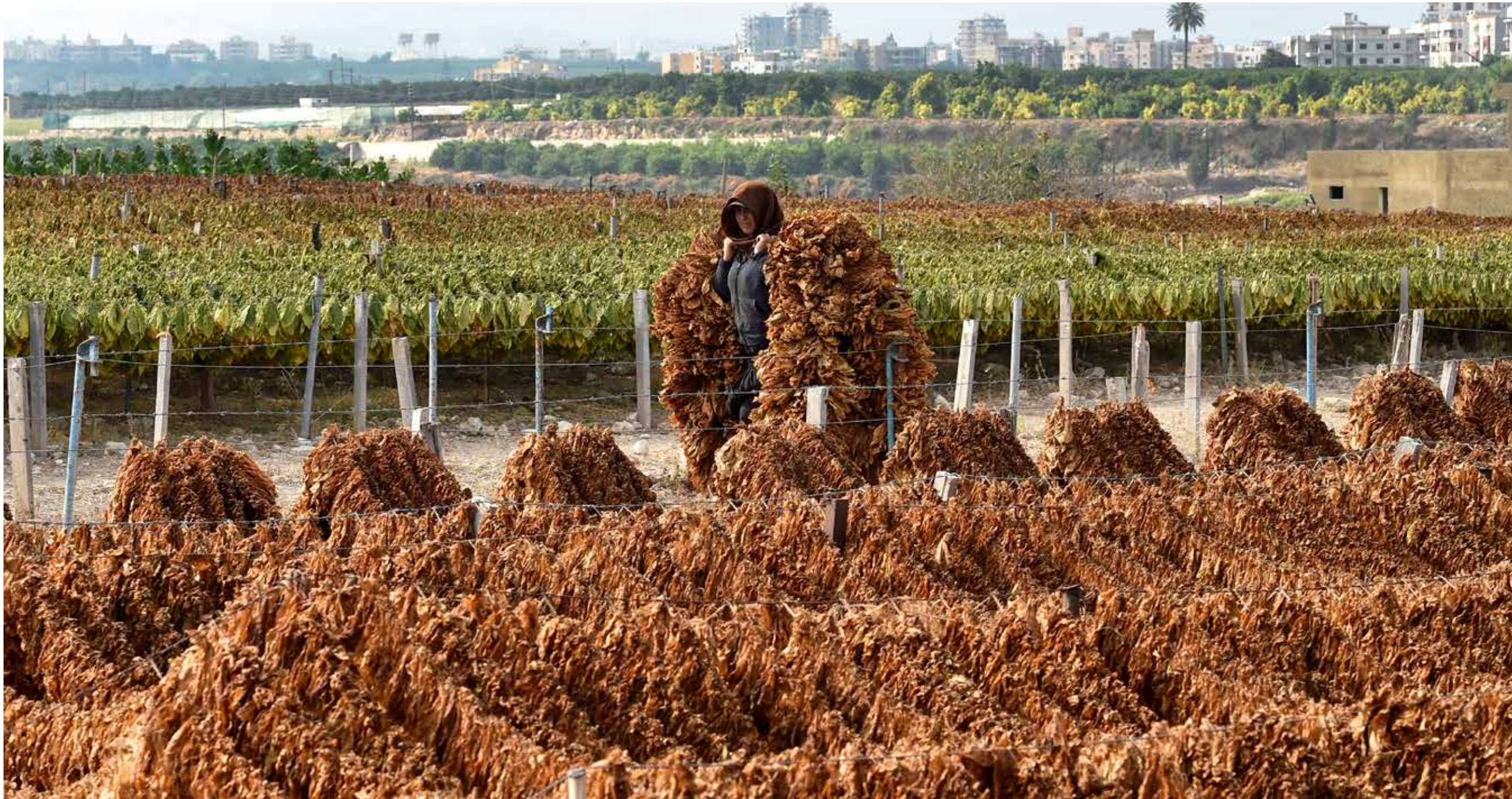
بصاينة وثبات، نعمل مَجَلَّه قَوَارِين المَشَاتِل.