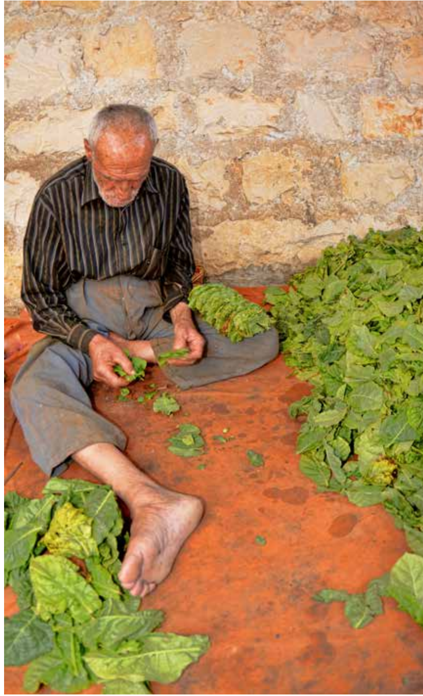
يُفَضِّي اللبَاءَ حَامِلَةً قَلْبَهُ الَّذِي لَا يَنَامُ، وَيُفَضِّي الشَّعَارَ حَامِلَةً نَجَائِسِهِ الَّذِي لَا يَغْفُو.