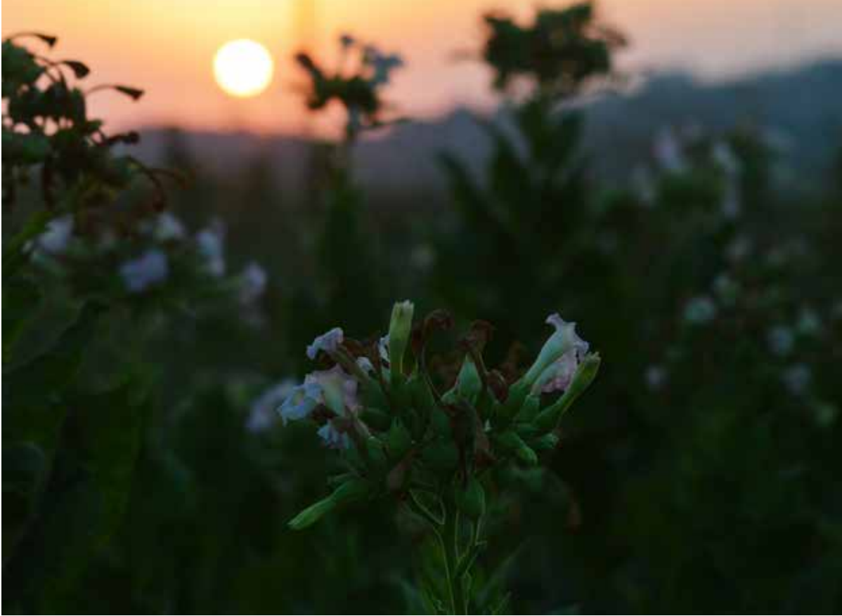
المصوِّرةُ سارةُ حمود

هي ودبعةٌ كَالْجَمِينِ عَلَى شَفَاوِ أَهْمَاتِنَا حِينَ تُتَقَرَّبُ دَعَاؤُنَا.