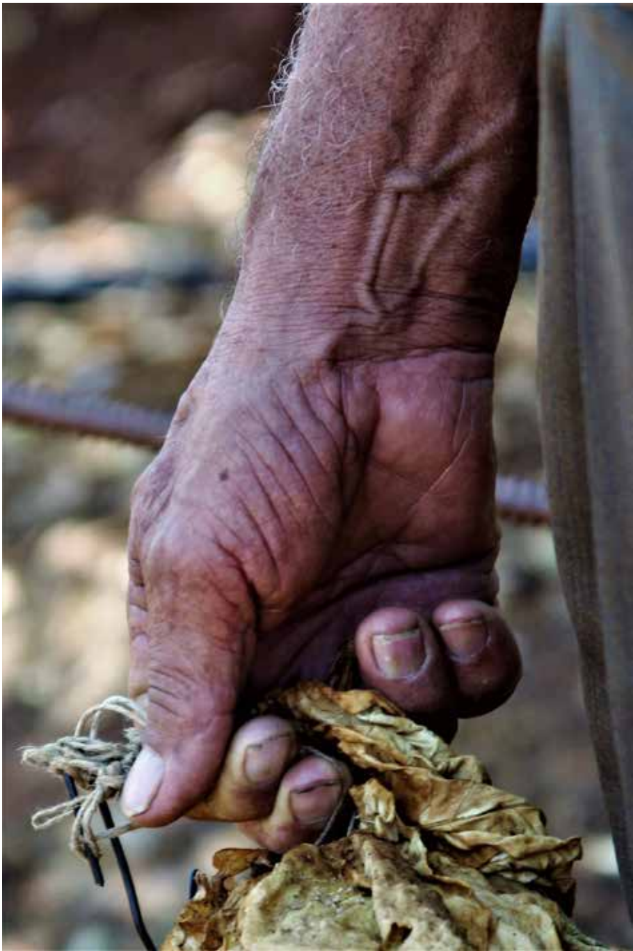
وَحَدَّهَا أَيْدِيكُمْ الْخَضْرَاءُ تَعْدُو فِي الْأَفْرَاسِ الْأَنْهَارِ وَالسَّيَابِعِ.

بُسْلَمَانِ الْآبَاءِ، وَوَحْدَةِ الْعَالَمِيَّةِ، وَتَمَاسُكُهَا بِدَايِدِ.