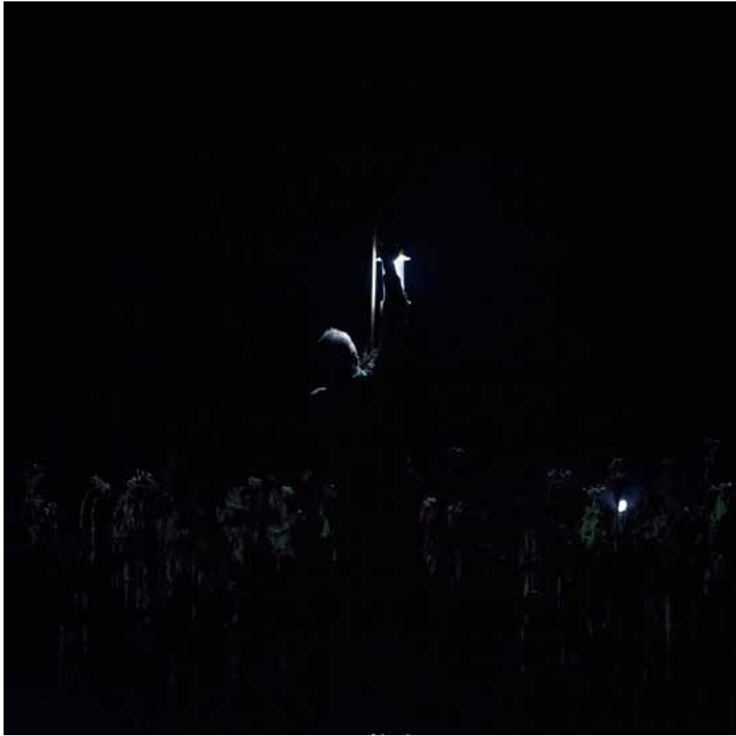
وخذة، والقمر البعيد... د قُرْبَجَفَةٌ فِي حَاكِيَةِ اللَّيْلِ.