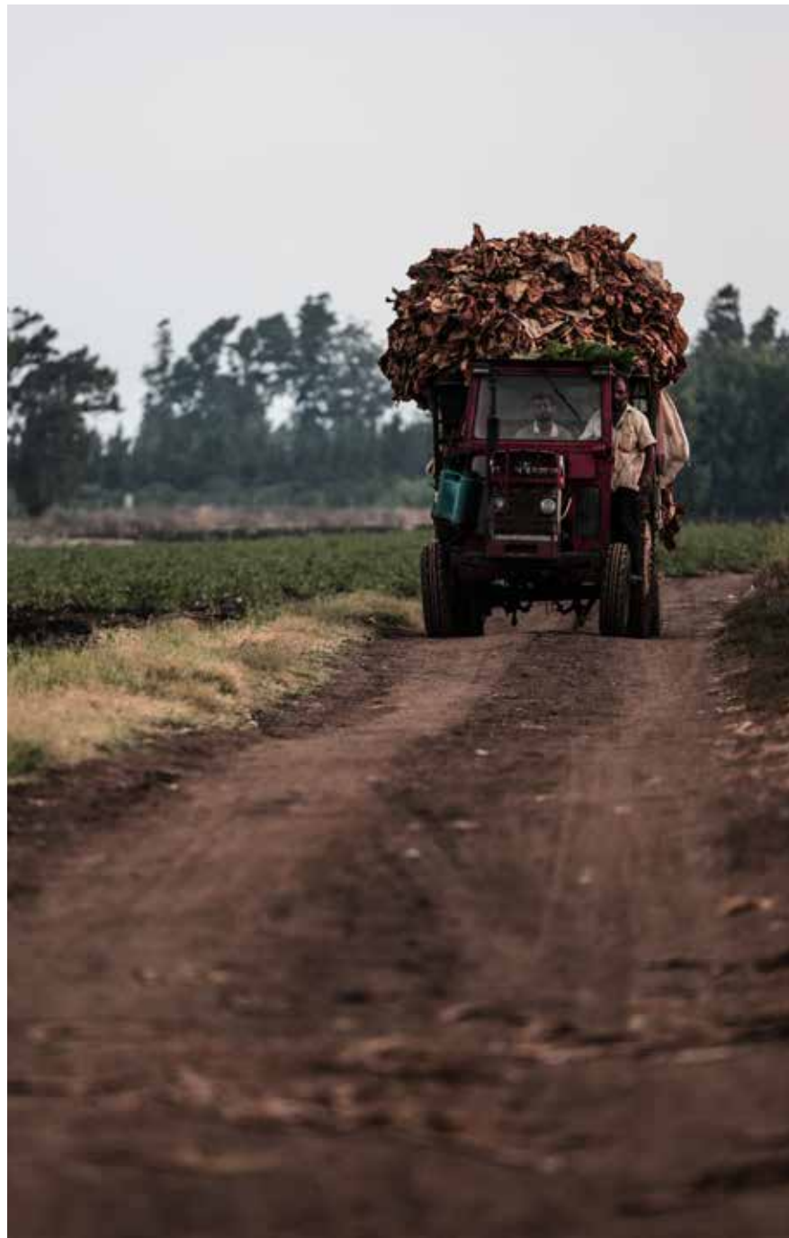
رحلةُ مَليئةٌ بِأَغْيَابِ وَأَشْيَاحِ أَنَاشِيدِ الْفَلَاحِينَ وَالْحَصَّادِينَ.