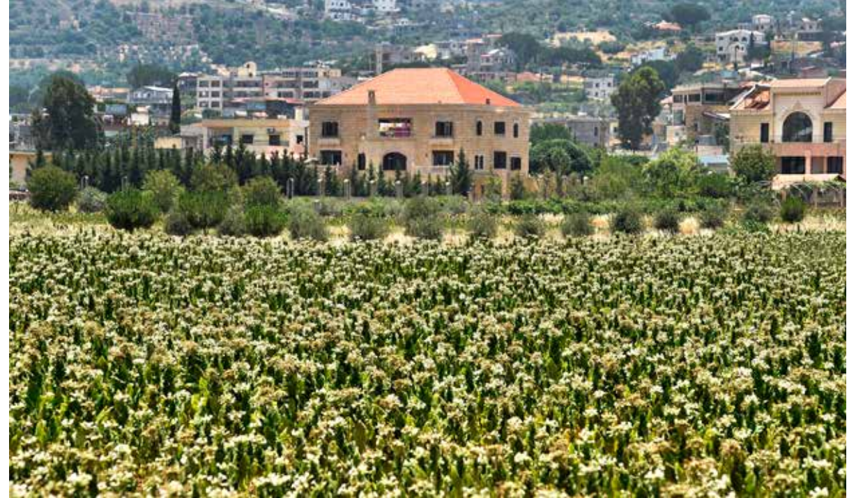
مِنَازِلِ مَسْوْرَةٍ بالتَّبْعِ.. وَمِنَازِلِ جُزُورِهَا متصلة بالأرض.