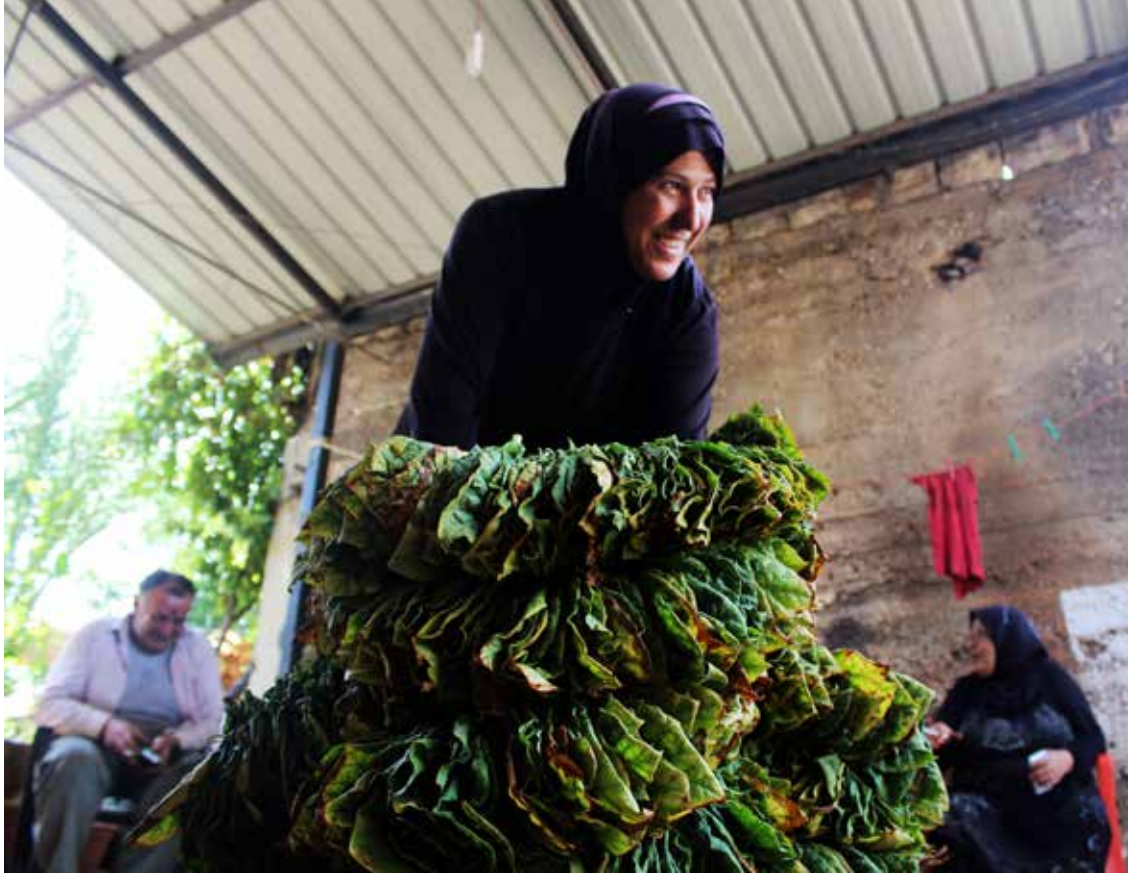
المصوّر هبة نعمة

تشهد على حكاياتهم وضكاتهم وتشهد أن الحب في قلوبهم لا يمهلهم موت.