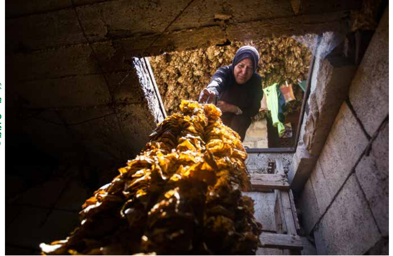
المصوِّرُ كَرِيكْسُ بَرِبْرِيان

تفتَحُ بابَ اللَّيْلِ على نورِ البنادِكِ.