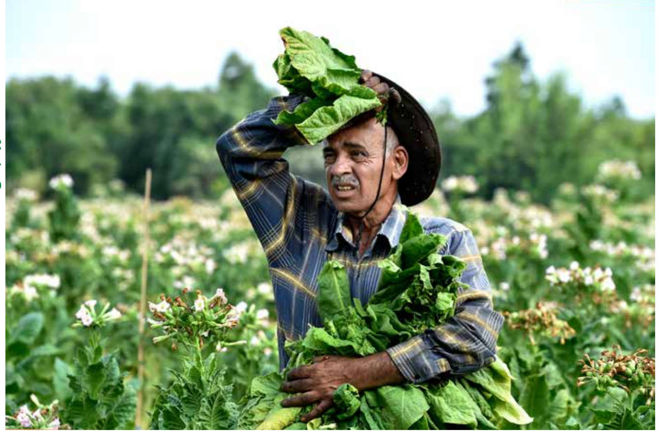
المصوّر عباس سلمان

لَمْ تَبْصُرْ كَفَيْهِ إِلَّا الحَوَاكِرَ المُزْدَهِرَةَ.