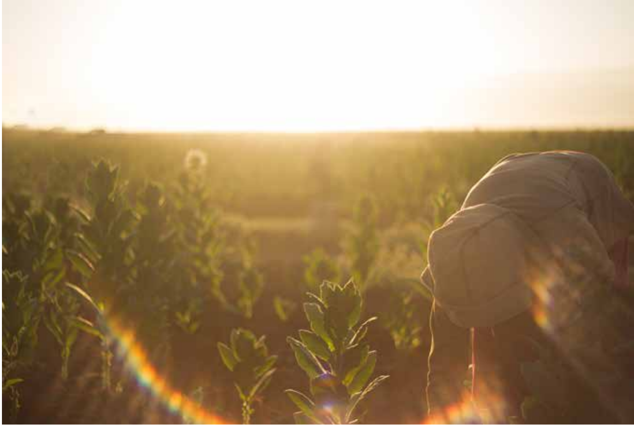
يُسابِقون الشمس نحو الحقول، قَبْلَ أن تجفّ قطرات الندى.