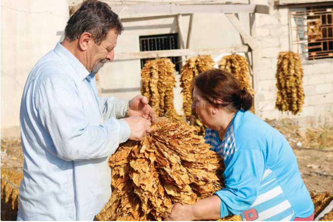
كَبْرًا مَعًا بَيْن المَسَاكِبِ والمَشَاتِلِ.