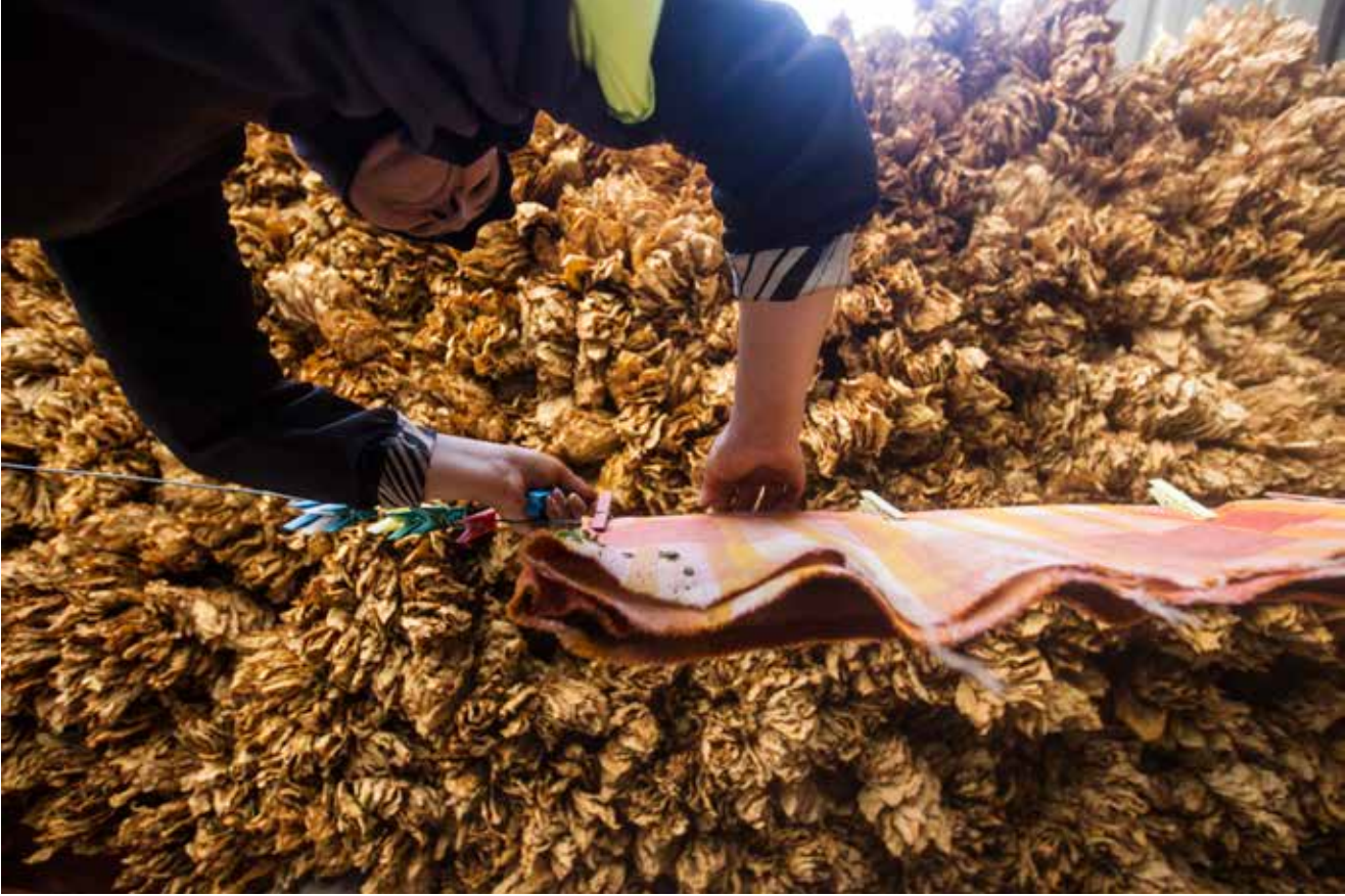
المصوِّرُ كَرِيكْسُ بَرِبْرِيان

تَنْشُرُ تَعْبِهَا وبأسها تحت عيونِ المَوَاسِمِ