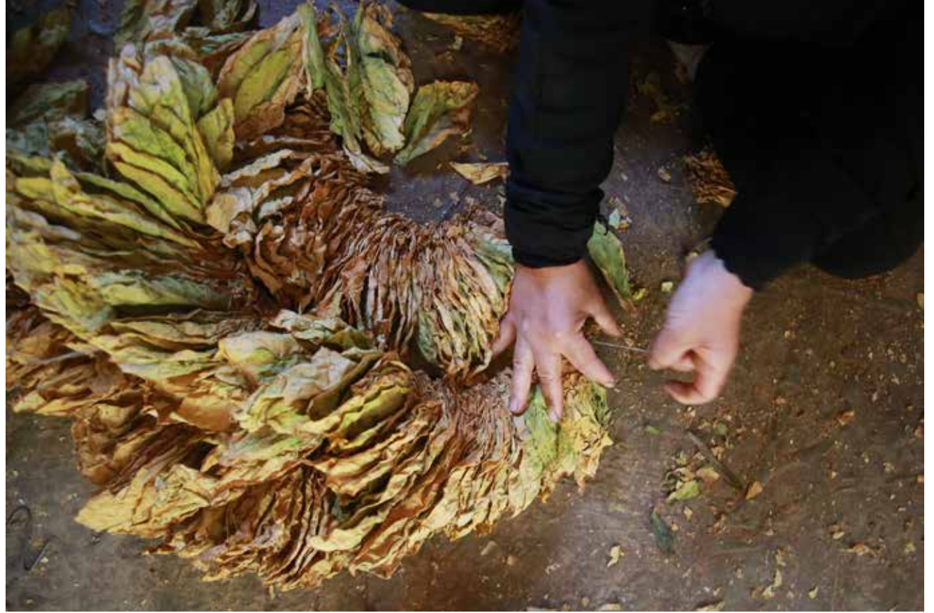
يُداها الخَضَبَانُ تُجَل قساوة القَيْرِ.