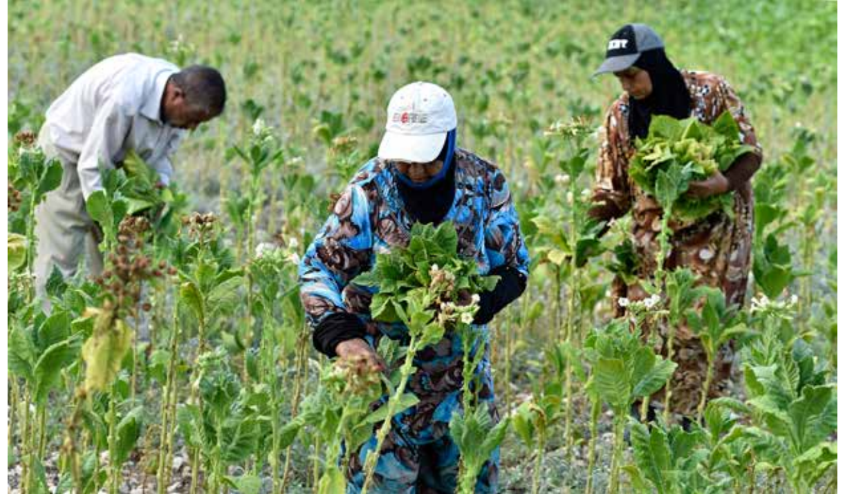
المصوِّرُ عباسُ سلمان

بصِرُونَ عَلَى الشَّهَارَاتِ الَّتِي تَفْضِي، مِنْ عِيُونِ الصُّورِ، ويخطلونَ